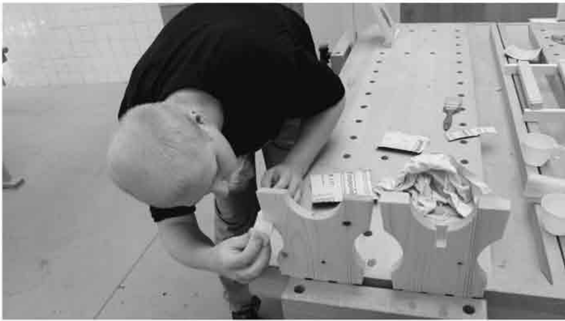
NÁVŠTEVA Z FÍNSKA